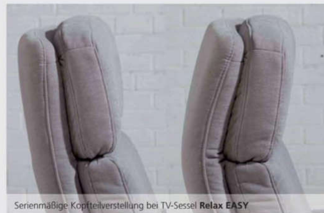
Serienmäßige Kopfteilverstellung bei TV-Sessel Relax EASY