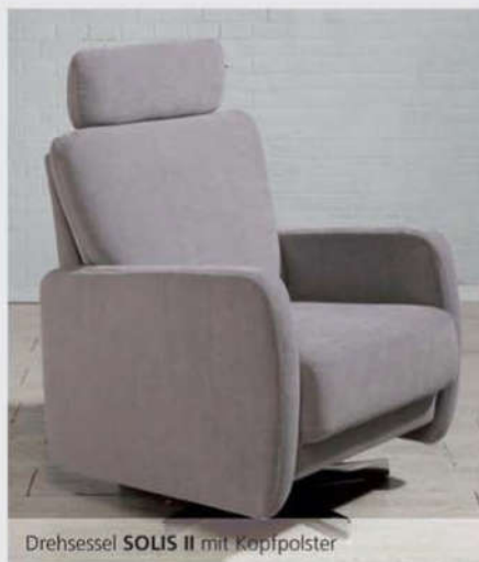
Drehessel SOLIS II mit Kopfpolster