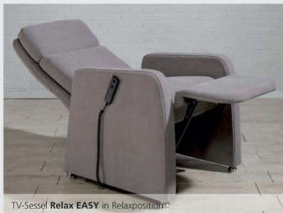
TV-Sessel Relax EASY in Relaxposition