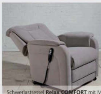
Schwerlastsessel Relax COMFORT mit M2 – separates Verstellen von Rücken und Fußablage