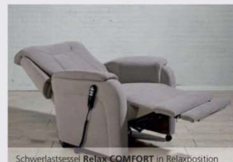
Schwerlastsessel Relax COMFORT in Relaxposition