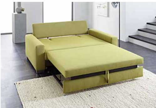
AL 1 140 cm mit Schlaffunktion AL 1