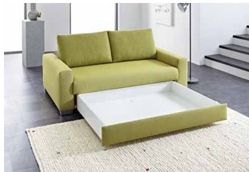
AL 1 140 cm mit Bettkasten AL 1