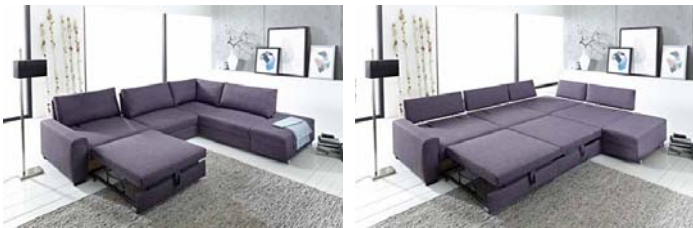
AL 1 90 cm mit verschieb. Fußteil 90 cm mit Schaufunktion Spitzende 90 cm ohne Schaufunktion Anbauhocker