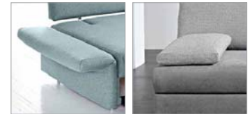
Typ 3 abklappbar