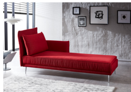
Liege mit Hochstellrücken