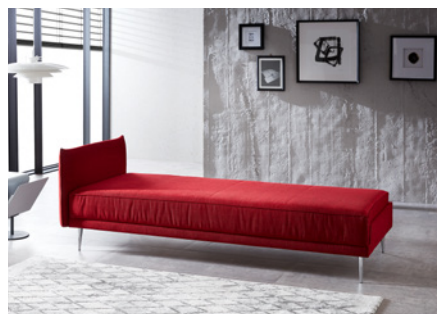
Liege mit festem Steckelement