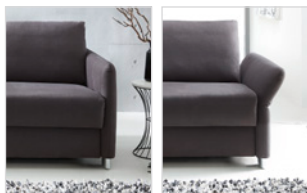
Armlehne Typ 1