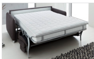
Schlafsofa mit Funktion