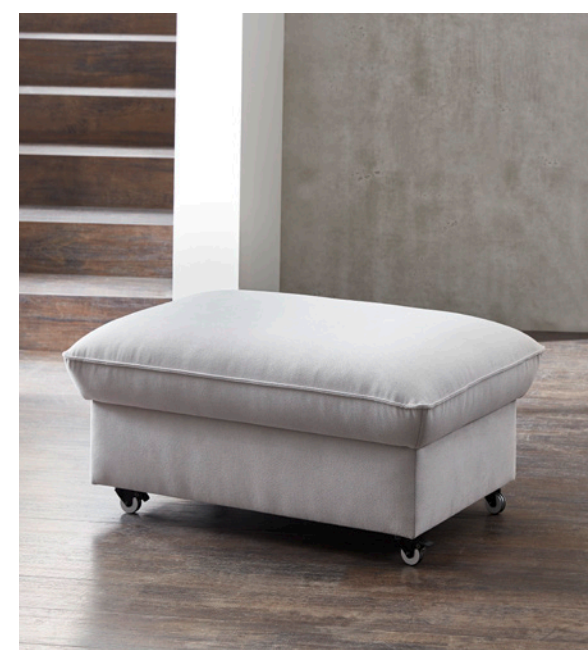
Hocker mit Bettkasten (geschlossen)