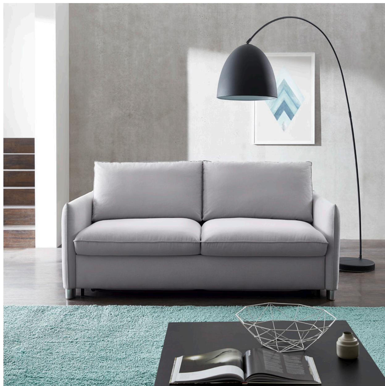
Armlehne Typ 1