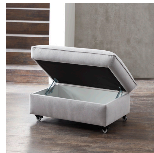
Hocker mit Bettkasten (geöffnet)