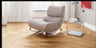
1-Sitzer ohne Armlehnen