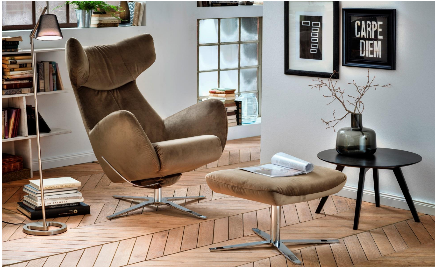
Einzelstuhl + Hocker im Bezug Velvet oliv