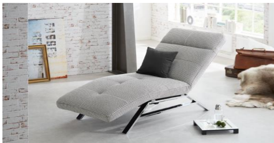
Einzelliegeim Bezug Classy black