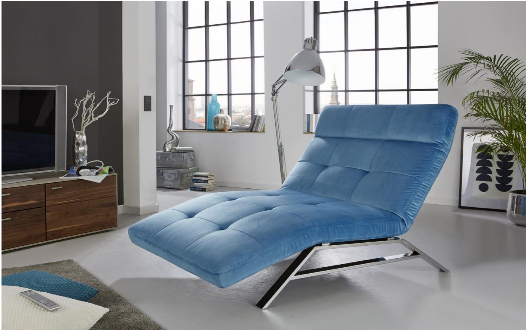
Einzelliege Maxi im Bezug Velvet petrol