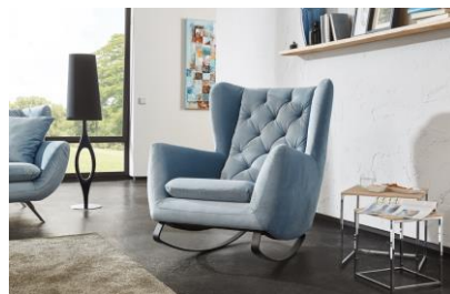
Schaukelsessel im Bezug Velvet light blue