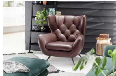
Hochlehnsessel im Bezug Leder Torero dark brown