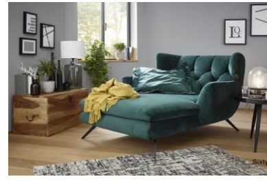
Longseat im Bezug Velvet smaragd