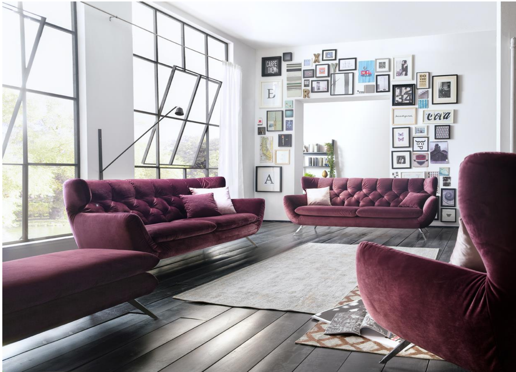
3-Sitzer / 2,5-Sitzer im Bezug Velvet purple