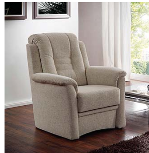
Sessel mit Sitz-Rücken-Verstellung (optional)