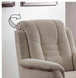
Komfortable Kopfteilverstellung (optional)