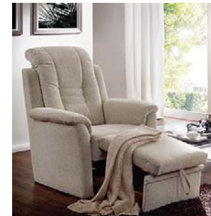
Sessel mit Fußhocker