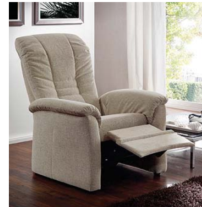
passender TV-Sessel erhältlich