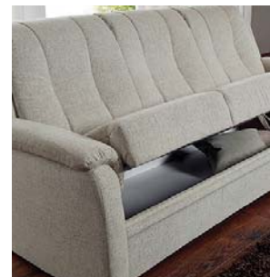
... mit Stauraum