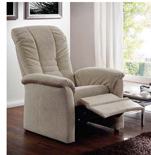
passender TV-Sessel erhältlich