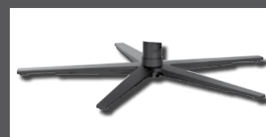
Metall-Sternfuß verchromt Edelstahl optik oder pulverbeschichtet anthrazit