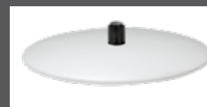
Bezogener Teller (Leder oder Stoff)