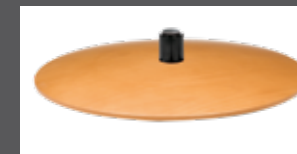
Holzteller in mehreren Farben