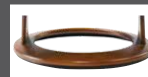
Holzdrehring in mehreren Farben