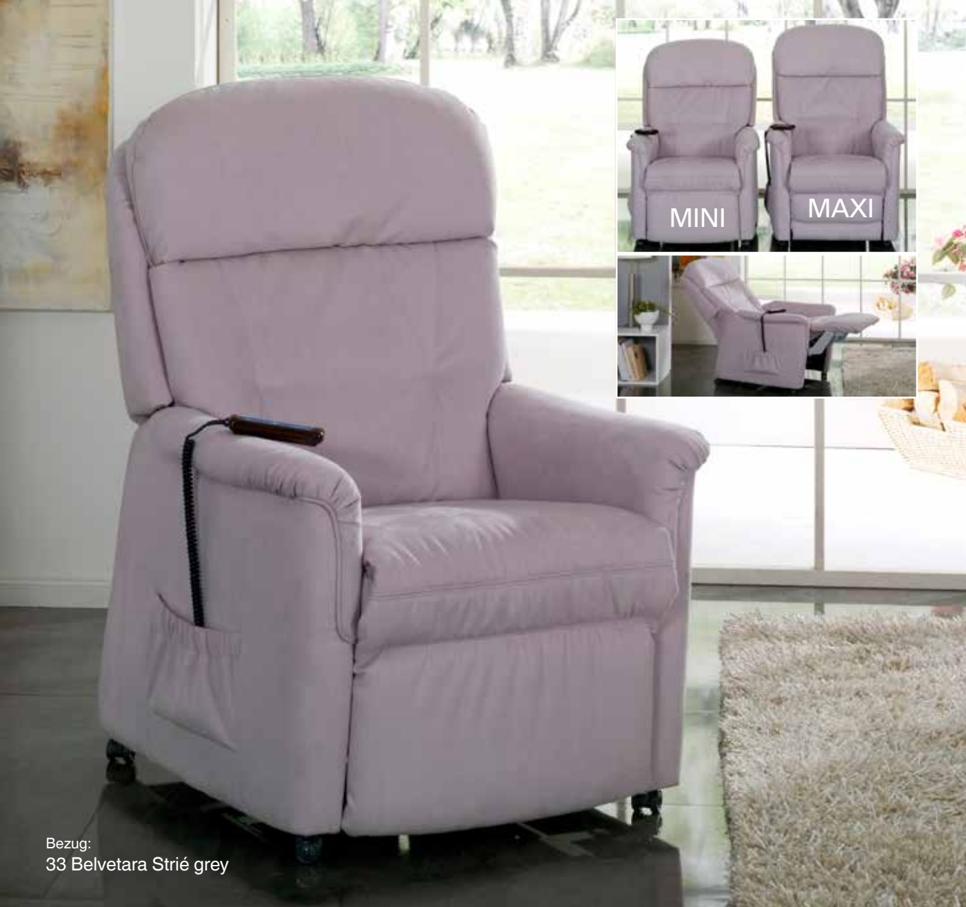
Bezug: 33 Belvetara Strié grey