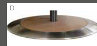
Holz mit Edelstahlring