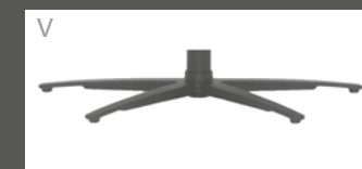
Sternfuß Anthrazit pulverbeschichtet