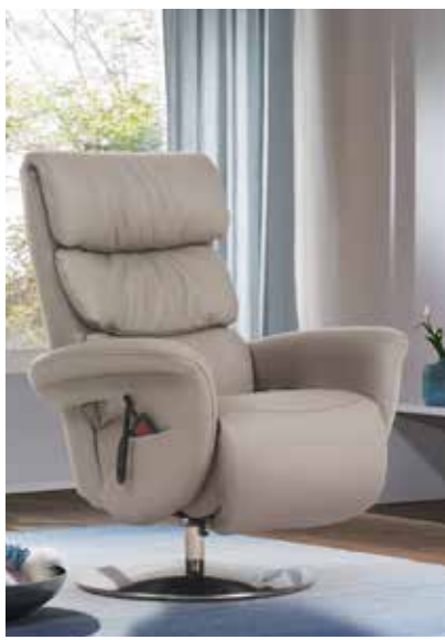
ohne Massage siehe Modell 7228