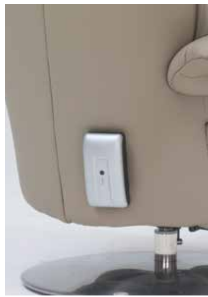
ohne Massage, mit außenliegendem Akku siehe Modell 7628