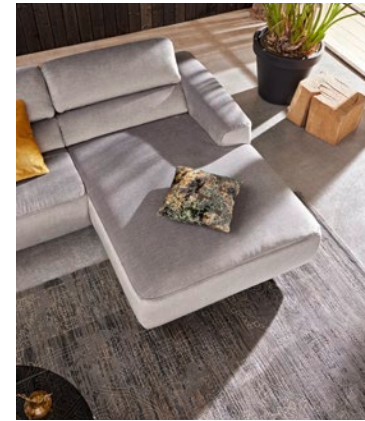
Long chair with motorised part-extending function