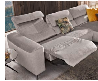
Anreihsofa mit motorischer Wall-Away-Funktion