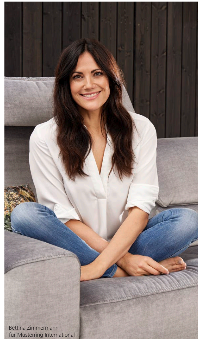
Bettina Zimmermann für Musterring International

The leading role at home is now played by Musterring.