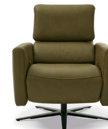
Relaxsessel MR 261 in Leder moos Relax chair MR 261 in moss leather