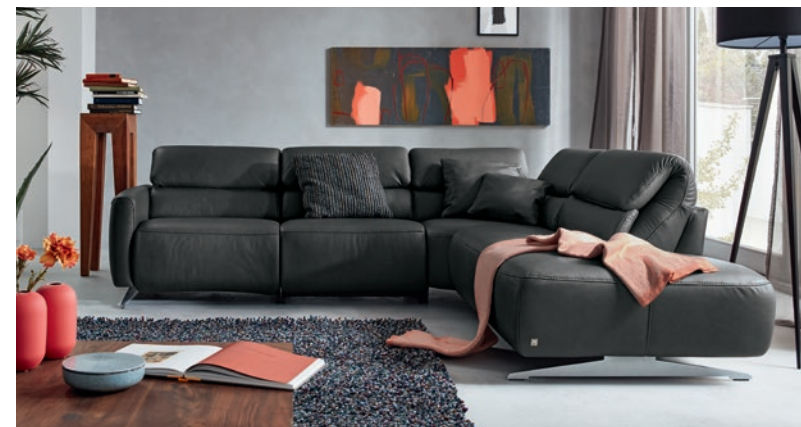
MR 260 in Leder anthrazit MR 260 in anthracite leather