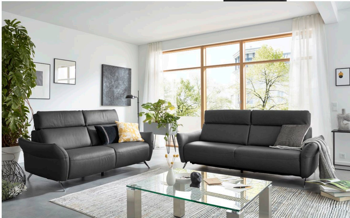
In Leder Rodeo charcoal: Sofa 3-sitzig (3KV), ca. B 216 cm, Sofa 2,5-sitzig (2,5KV), ca. B 188 cm; jeweils ca. H 98/114, T 103 cm, Metallfuß chromfarbig