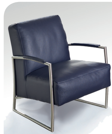
1D Einzelstuhl mit Inlettauflage