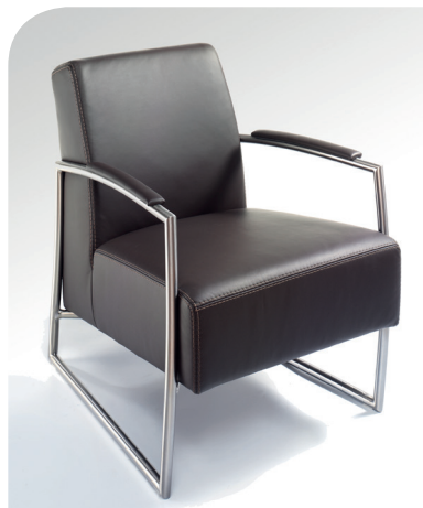
1B Einzelstuhl mit Steppennaht