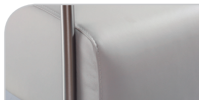
Kapennaht (keine Kontrastnaht möglich)