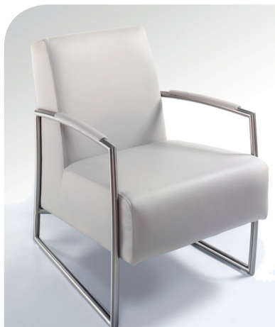
1A Einzelstuhl mit Kapennaht