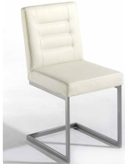
1B Freischwinger mit Rückensteppung Metall champagnerfarbig