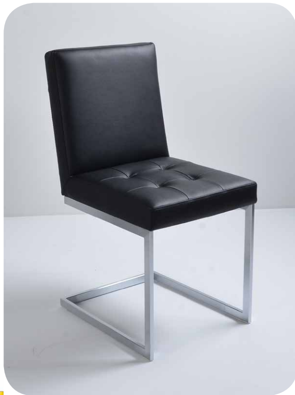
1A Freischwinger mit Sitzsteppung Edelstahloptik gebürstet