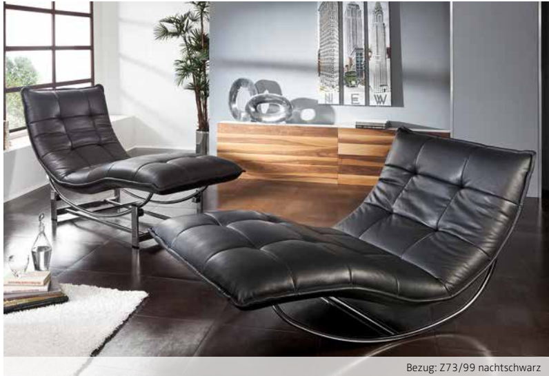
Bezug: Z73/99 nachtschwarz