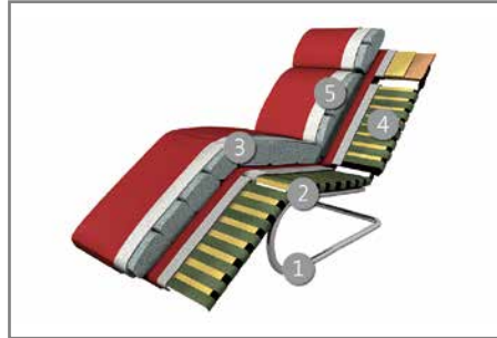
Das Design des hier abgebildeten Querschnitts entspricht nicht dem Modell dieses Katalogblattes.