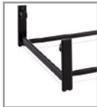
Fußuntergestell schwarz, gegen Aufpreis