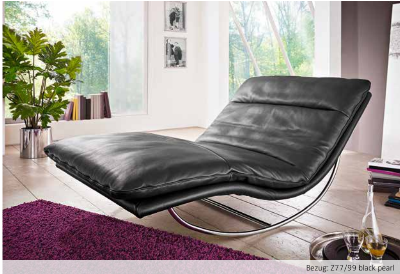
Bezug: Z77/99 black pearl