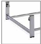
Fußuntergestell Chrom glänzend, gegen Aufpreis