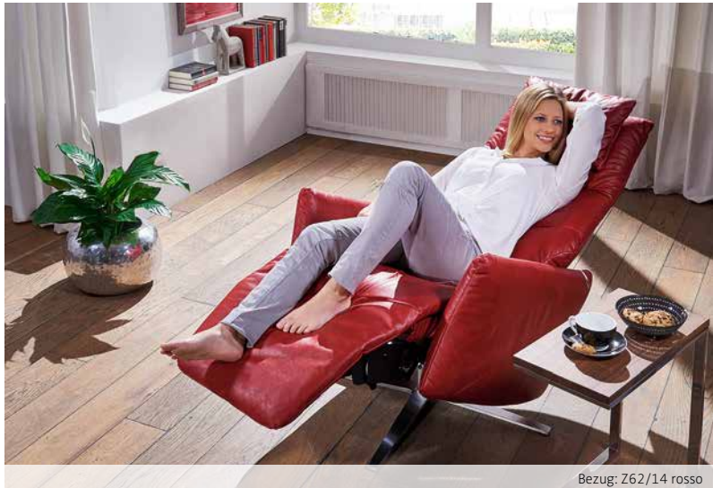
Bezug: Z62/14 rosso