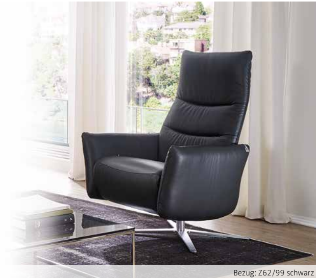
Bezug: Z62/99 schwarz