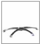
Sternfuß Chrom glänzend - FU 1 F U1