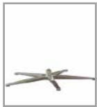
5-Sternfuß versch. Metallfarben 3 Sitzhöhen F U1