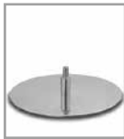
Drehteller versch. Metallfarben Mehrpreis 3 F U2.