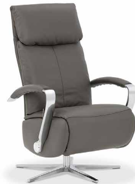
Bezug: Z73/95 graphit

Dieser Allekönner punktet durch verschiedenste Komfortfunktionen . Der Sessel ist als Small-, Medium- oder Large-Variante erhältlich. Die Sitz- /Rückenverstellung ermöglicht es - optional auch elektrisch - ganz relaxt die Seele baumeln zu lassen.