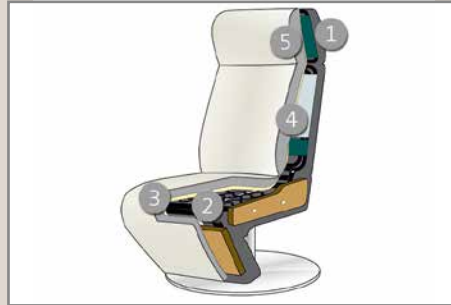
Das Design des hier abgebildeten Querschnitts entspricht nicht dem Modell dieses Katalogblattes.