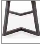
Gestell "W" schwarz, Edelstahl gg. Aufpreis